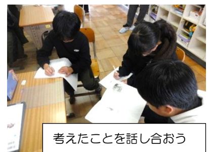
考えたことを話し合おう

やすい授業になるよう先生たちは努力をしています。みなさんもお家で宿題などをしっかりしたり積極的に授業に参加したりするようがんばりましょう。