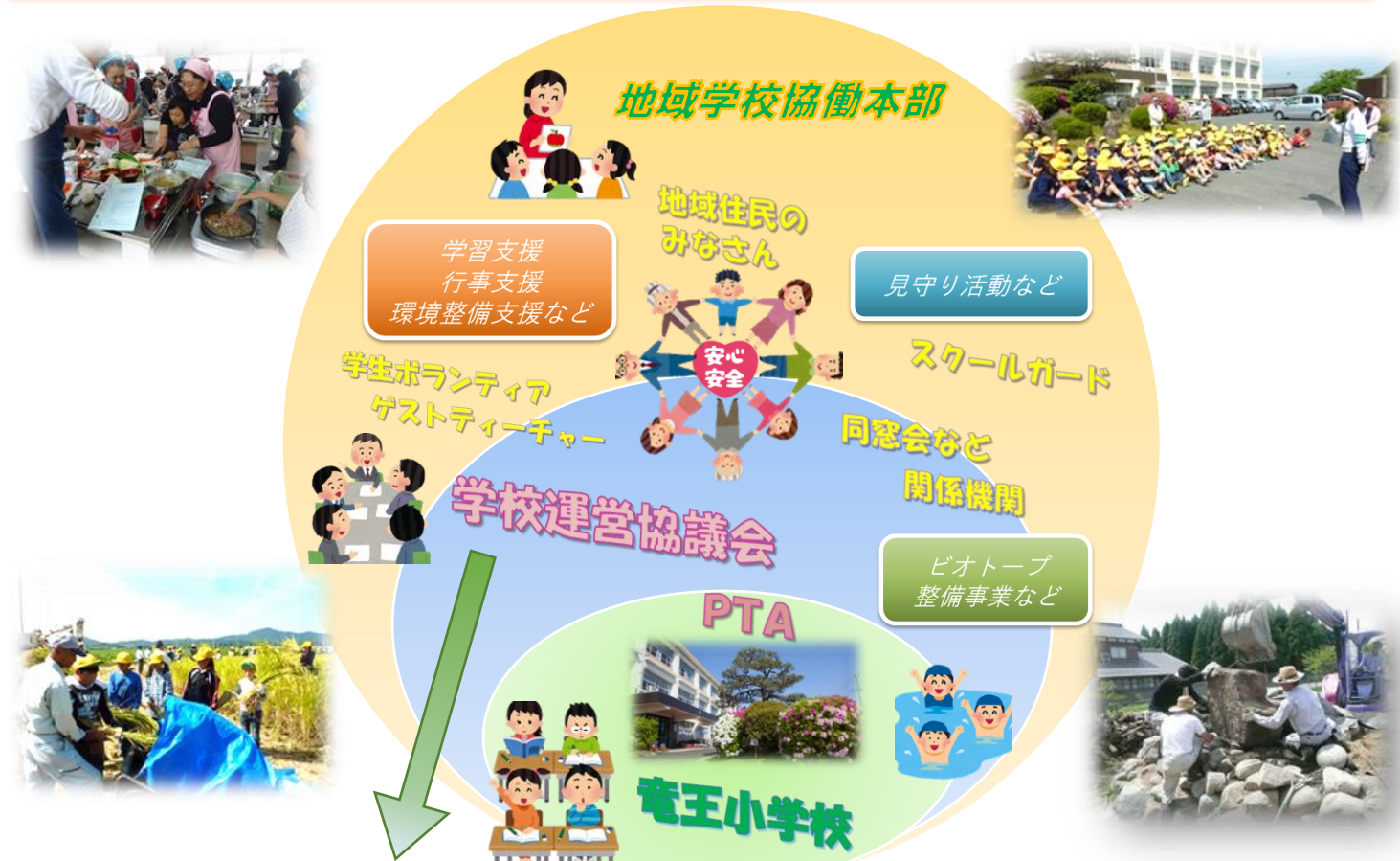
学校運営協議会の体系図

学校と地域がパートナーとして、連携・協働するために、学校は「地域に開かれた学校」から一步踏み出し、地域でどのような子どもたちに育てるのか、何を実現していくのかという目標やビジョンを地域住民・保護者と共有し、地域一体となって子どもたちを育む「地域とともにある学校」に転換していく必要があります。コミュニティ・スクール(学校運営協議会制度)は、学校と地域住民・保護者が力を合わせて学校運営に取り組むことが可能となる「地域とともにある学校」に転換するための仕組みです。これにより、地域ならではの創意や工夫を生かした特色ある学校づくりを進めることができます。