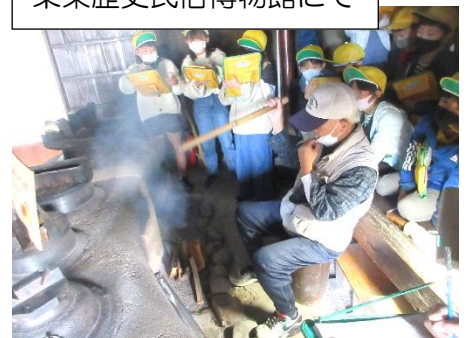
栗東歴史民俗博物館にて

3年生は、竜王町にあるもも園や牧場、工場見学に加えて、栗東歴史民俗博物館と日清食品関西工場へも出かけました。学習のテーマは「まちではたらくひとびと」と「くらしのうつりかわり」です。まちで働く方たちのお話を聞き、働くことの大切さややりがいなどを学びました。栗東歴史民俗博物館では、昔の家や道具について学び、くらしの移り変わりについて知ることができました。日清食品関西工場では、カップヌードルがどのように作られているのか見学し、オリジナルカップヌードルを作りました。